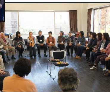
【認知症予防 スリーAプログラム】